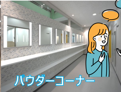
パウダーコーナー